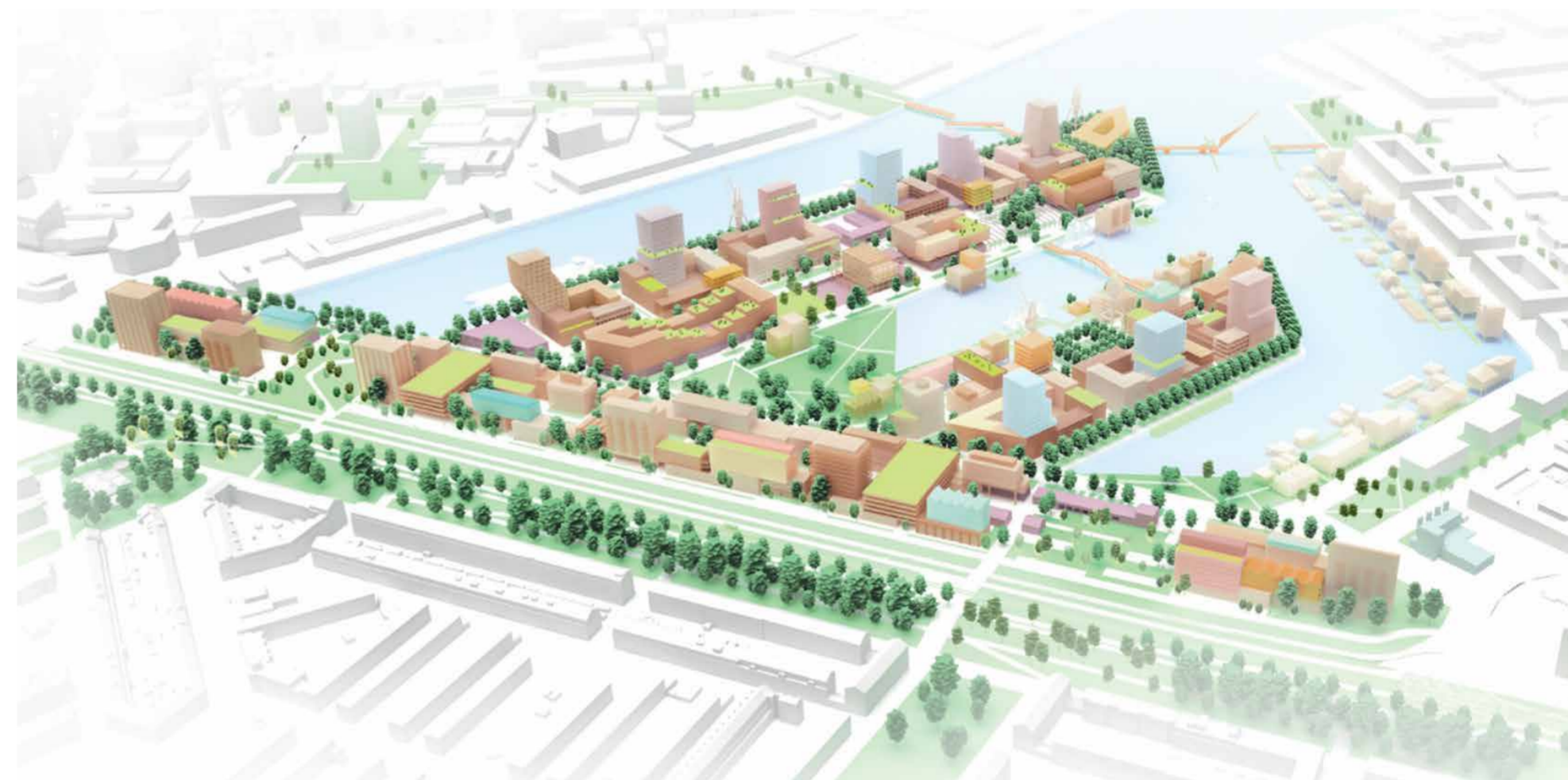
Masterplan Merwehaven (2023), impressie van Gemeente Rotterdam in samenwerking met bureau UFO-urbanism en OBSCURA