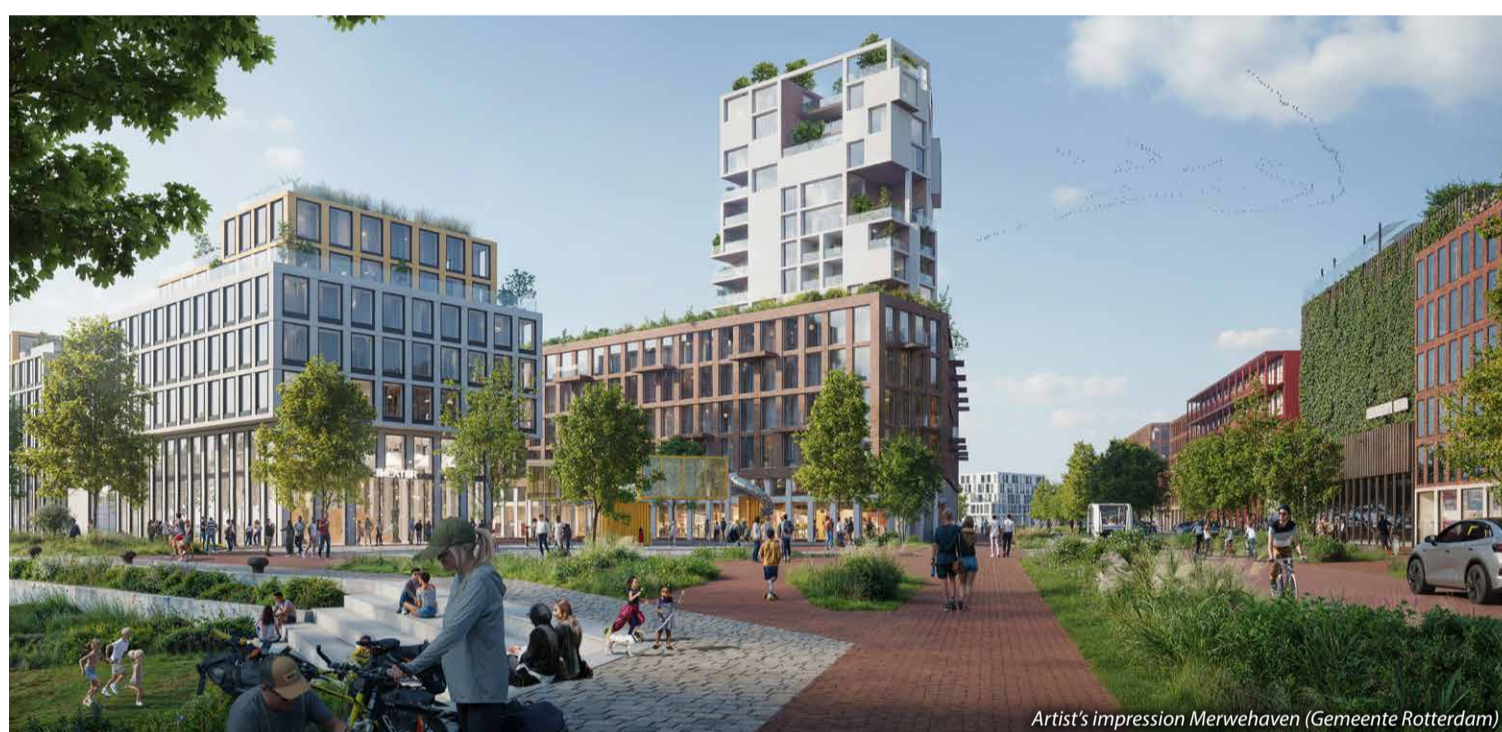
Artist's impression Merwehaven (Gemeente Rotterdam)